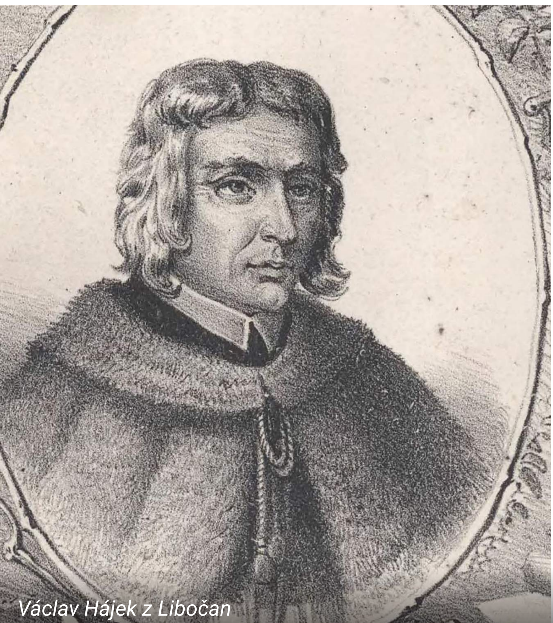
Václav Hájek z Libočan